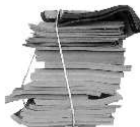
Ein schlecht gepacktes Remissionspaket